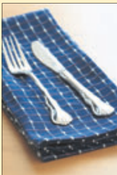
Lautasliinat, 20 kpl/pkt 29 mk