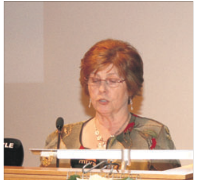
Lea Mäkipää toivotti Timo Soinille siunausta presidentinvaalityöhön.