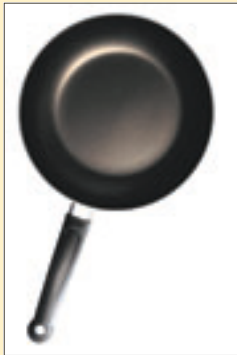
Paistinpannu (24 cm) 392 mk

Suoraan markkoiksi muutettuina monien tuotteiden ja palveluiden hinnat näyttävät hurjilta. Alla satunnaisia poimintoja kaupungilta: