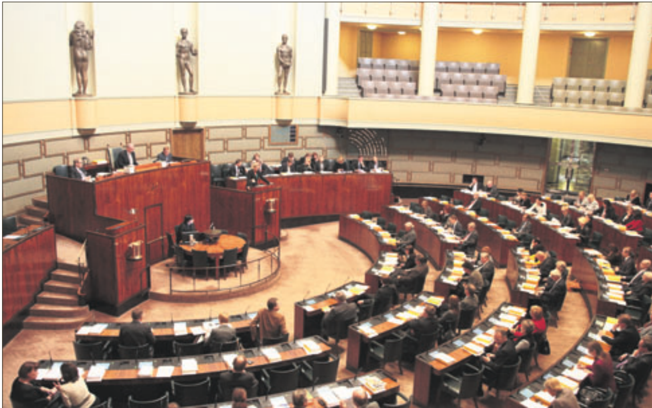
Kuva täysistunnosta, hallituksen esitys eduskunnalle valtion talousarvioksi vuodelle 2012.

Yhteiskuntamme rakenteiden säilyttäminen näissä vaikeissa oloissa edellyttää verojen nostamista, mutta hallitus on toteuttamassa korotukset väärällä tavalla. Polttonesteverotuksen nostaminen vahingoittaa paitsi kuljetusalaa, myös hyvin laajaa joukkoa tavallisia palkansaajia ja erityisesti reuna-alueilla asuvia kansalaisia. Eikö hallitus haluakaan pitää koko Suomea asuttuna? Verotusta olisi muutettava siten, että se kohdistuisi paremmin kansalaisten maksukyvyyn mukaan. Perussuomalaiset olisivat valmiita korottamaan erityisesti kaikkein suurituloisimpien ansiotuloverotusta.