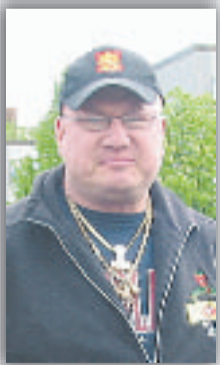
Tony Halme Kansanedustaja PerusSuomalaiset